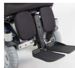
Ap. Pernas Central Elétrico LNX