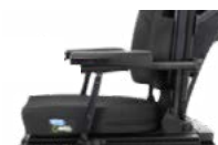
Ap. Braço Reclinável