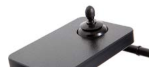
2233 + 2241